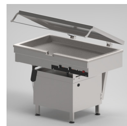
Plant och välbalanserat lock