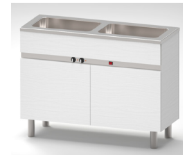
Kan fås i laminatutförande