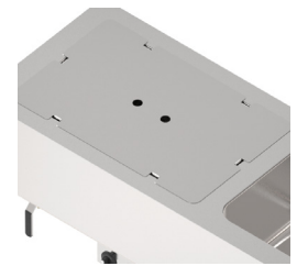
Täcklock finns som tillval