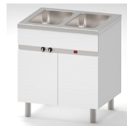
Kan fås i laminatutförande