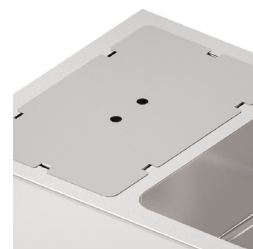
Täcklock finns som tillval